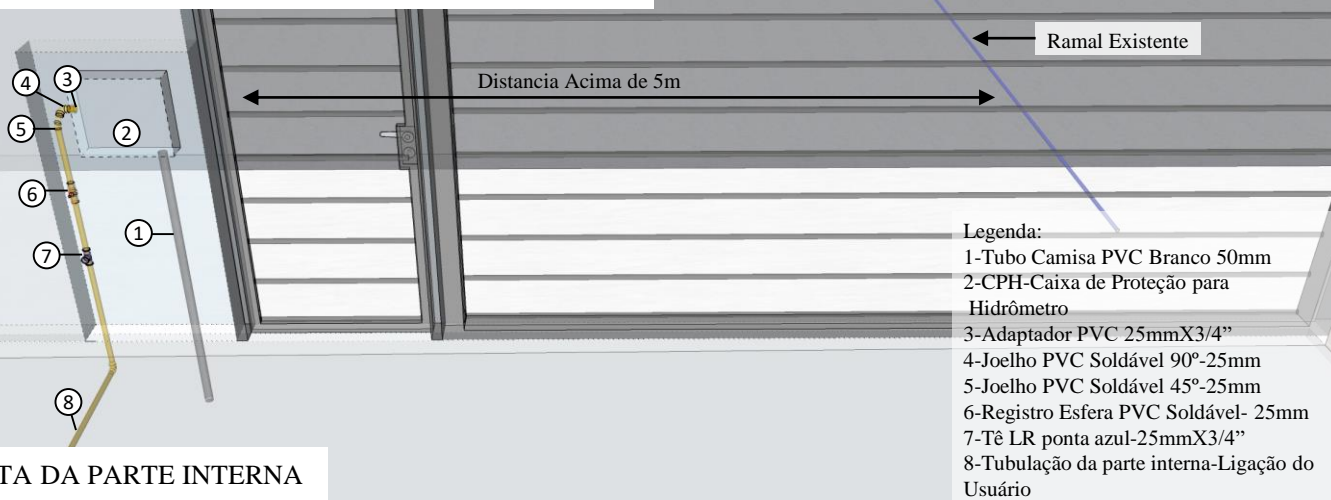
Fig.1-VISTA DA PARTE INTERNA

Parte interna a ser deixada pronta pelo usuário